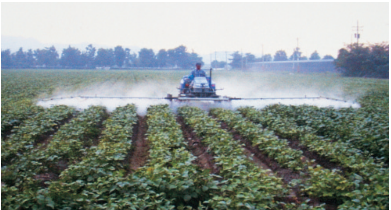
圖 7. 多功能桿式噴藥機