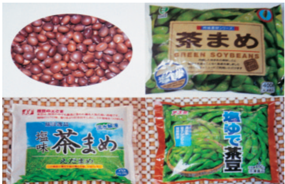
圖 11. 芋香毛豆以茶豆為主

（2）毛豆 主要消費型態大略可分為加工冷凍毛豆（圖10）、生鮮冷藏毛豆及調製毛豆3種，其