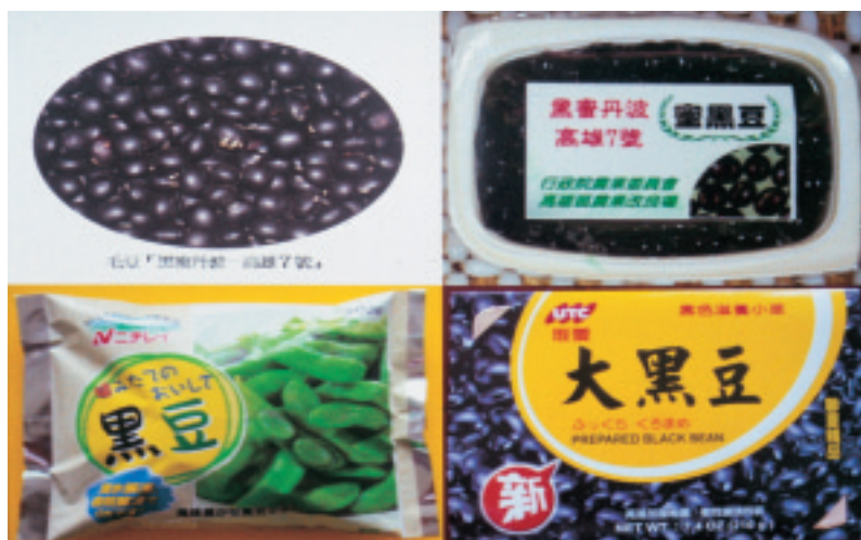
圖 12. 大黑豆可加工製成黑毛豆（左）及蜜黑豆（右）

中以冷凍毛豆為最大宗，其次為生鮮冷藏毛豆，而調製毛豆數量較少。另外亦積極開發芋香毛豆品種如茶豆（圖 11）、黑豆等具有芋香味品種及毛豆多樣化加工技術，如毛豆布丁、毛豆腐及毛豆粉末等製品。