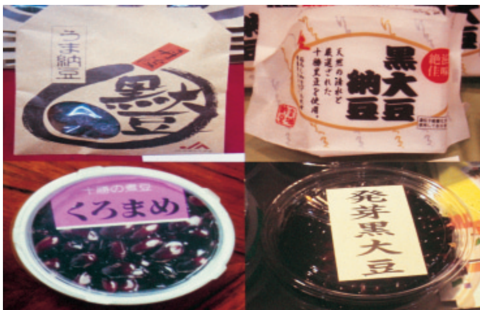
圖 13. 黑大豆相關產品

台灣大豆產業未來應朝向鮮食、加工及保健產品發展，並以非基因食品為目標，善用台灣的優勢如優質品種、食品安全及加工技術等，尤其毛豆屬外銷型產業，是目前農產品外銷最大宗作物，應加強開發芋香毛豆品種，推動大農場企業化經營，降低生產成本。如此大豆產業仍是台灣農業未來發展的重要經濟作物。