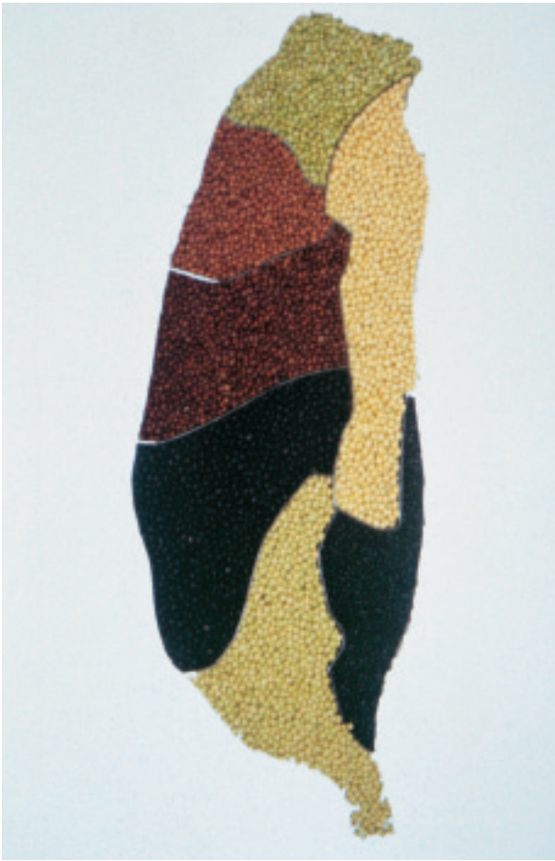
圖 1. 台灣大豆

750 餘萬公頃。1990 年以來，全世界大豆年產量約在 1~1.5 億公噸，且呈現逐年增加趨勢。1993 年以後，美國、巴西、阿根廷大豆產量分別占世界總產量之 51%、19%、10%，中國大陸位居第四僅為 8%。