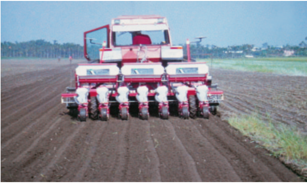
圖 5. 毛豆整地理石施肥播種機

痘病、紫斑病及豆莢螟等。因此在開花前及結莢期均需適時防治。防治藥劑及使用方法可參考行政院農業委員會編印之《植物保護手冊》。