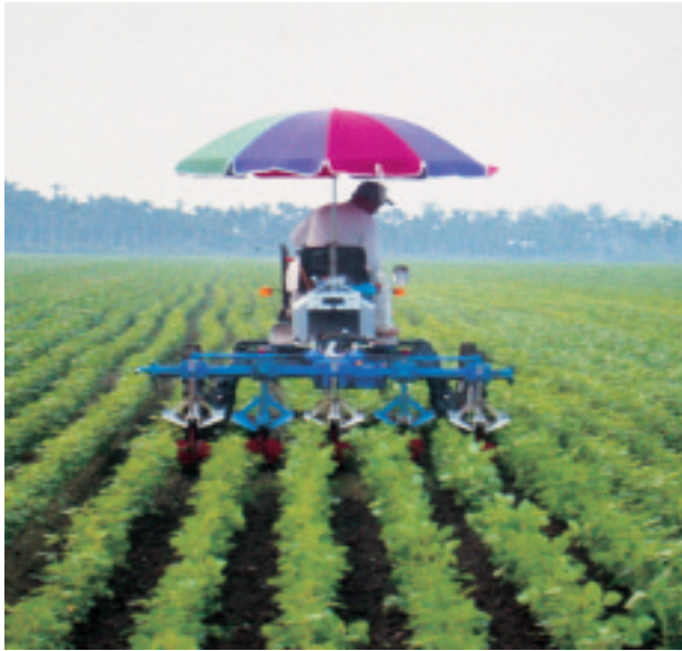
圖 6. 多功能中耕除草機

灌溉量，設定每小時行走速度，較傳統溝灌節省水資源達 80% 以上，作業效率每小時約 0.3~0.4 公頃（圖 8）。