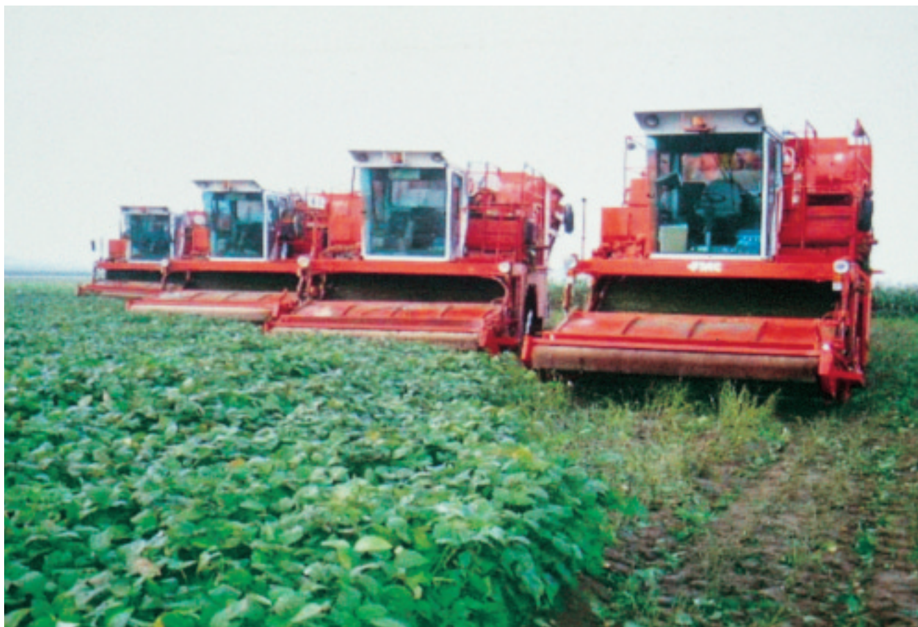
圖9. 毛豆 FMC7100 型採收機