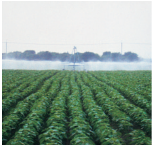
圖 8. 自走式桿式噴灌車