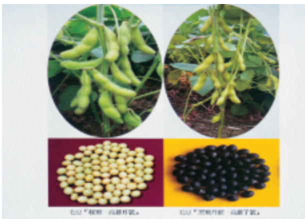
圖3. 毛豆「綠蜜—高雄6號」及「黑蜜丹波—高雄7號」

有關轉殖基因大豆品種的育成是近來關注的焦點，如抗除草劑轉殖基因大豆即可對特定除草劑產生抗性，至民國87年4月底止，美國共有33種基因轉殖作物通過審核正式准許商品化，至民國89年種植轉殖基因大豆面積已達2,580萬公頃，但值得爭議的是，這種轉殖基因大豆在自然界並不會產生，而這些作物在新的遺傳背景中會產生什麼樣的作用，這些基因轉殖作物隨著貿易自由化的方式大量的進口到國內，因此行政院農業委員會為推動農業生物技術研究發展，於民國87年5月公布「基因轉移植物田間試驗管理規範」，用以加強基因轉殖植物安全管理及維護生態環境，促進農業永續發展。