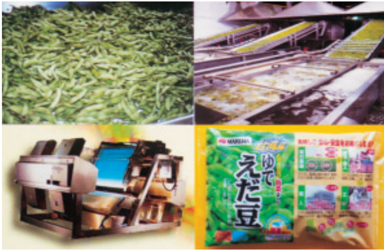
圖 10. 殺菁冷凍加工製成優質毛豆產品外銷

構物，被稱為植物性雌激素（phytoestrogens）。由於異黃酮具有女性動情激素（estrogen）之效果而無其缺點，在美國醫界已被做為荷爾蒙取代療法中之處方使用，對人體生理功能有：（1）可減少脂質氧化，預防粥狀動脈硬化。（2）可促進膽酸的排除，降低膽固醇。（3）可減少血小板凝集，防護心血管疾病。（4）可預防乳癌、攝護癌的發生。（5）可減輕婦女更年期症候群。（6）可改善骨質疏鬆症，防止老化的作用。